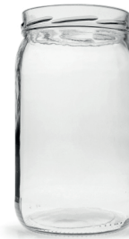
1/2 GALON 44 Oz