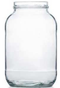
GALON 80 Oz